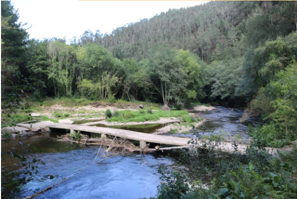
Restos da pontella sobre o Eo, entre Saldoira e Ervelle