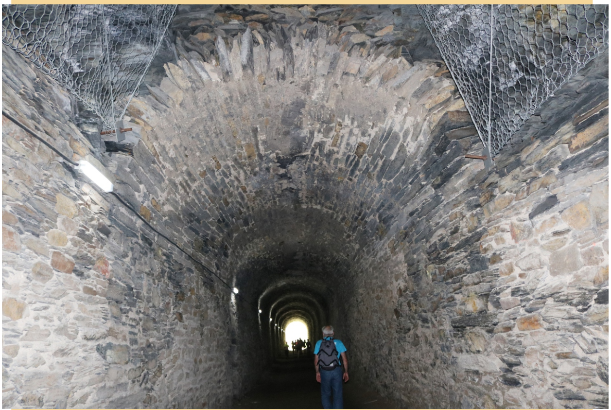
Os túneles están acondicionados con protección nas paredes e iluminación