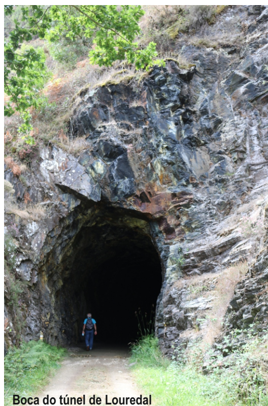
Boca do túnel de Louredal