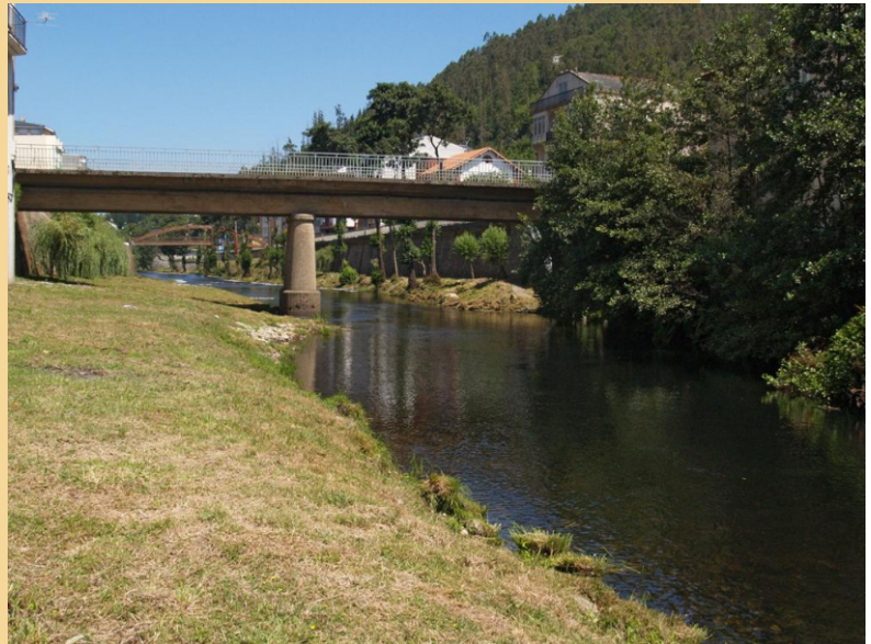
O Eo na Pontenova