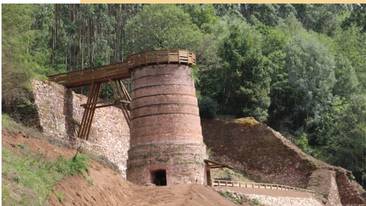
Forno de Bulloso