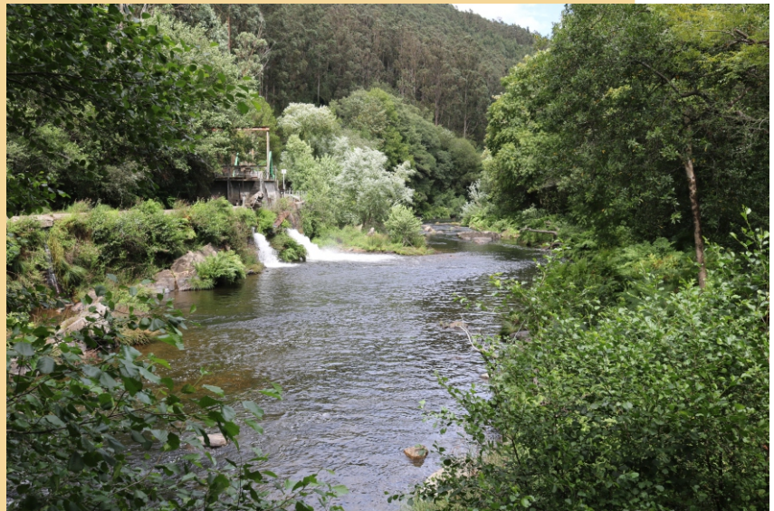
O Eo na presa da Central