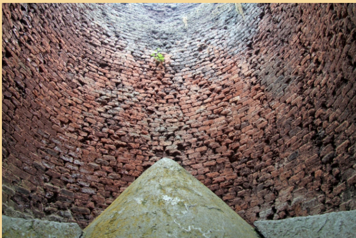
Fornos de calcinación de mineral de ferro en Vilaoudriz (A Pontenova). O primeiro forno levantouse en 1902 e chegou a haber ata cinco. Miden 11 metros de altura.